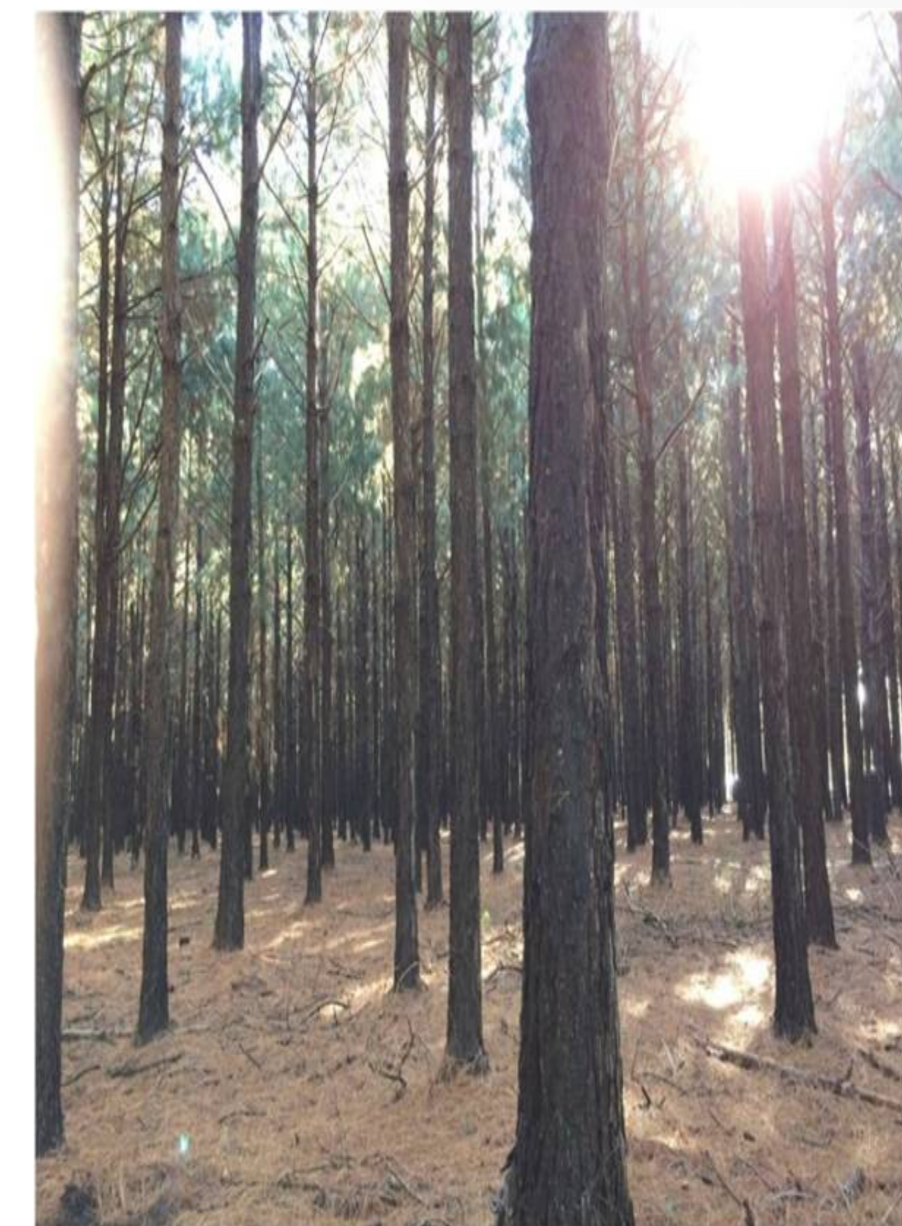
Figura 2: Forestación con Pinus sp. de 15 a 17 años de edad.