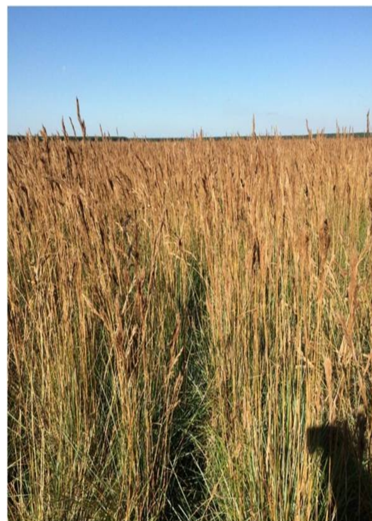
Figura 1: Pastizal natural ( Andropogon sp ).

Se empleó un diseño de muestreo completamente al azar, con dos tratamientos: pastizal (Pz) y plantaciones de Pinus sp (Pi) de 17 años. Fig 1 y 2. Se seleccionaron 3 lotes con 5 sitios de muestreo. Se extrajeron muestras compuestas a 0-0,10; 0,10-0,20; 0,20-0,30; 0-1 m. Se determinaron: densidad aparente (Da), textura, pH, respiración (RES), carbono orgánico (COS), nitrógeno total (NT) y nitrógeno potencialmente mineralizable (NPM). Se aplicaron los índices NPM/RES, NPM/MO, NPM/NT, COS/Li+Arc, C/N, COS/RES, índice estructural (IE) y las relaciones de estratificación del carbono orgánico (COS r1 y COS r2 ) y de nitrógeno (NTS r1 y NTS r2 ). Se efectuó un ANOVA y una prueba de LSD (P<0,05), como así también correlación de Pearson (P<0,05) entre variables.